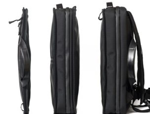
3層式の独立構造で用途に合わせてサイズと本体重量を調整