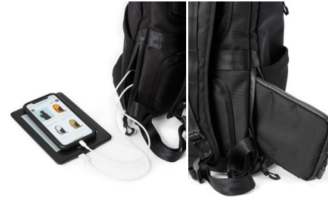
サイドポケットを活用すれば移動中もストレスフリーに

「URBAN COMMUTER BACK PACK 2」は都市通勤者のためにデザインされたミドルサイズのビジネスリュックです。コーディネートを選ばないクリーンな外観と、ビジネスシーンをより快適にサポートする機能性を両立しています。背負ったままの移動時間を快適にする機能性、最高のプレゼンテーションに必要なビジネスツールを効率良く収納する機能性、そして最高のパフォーマンスに直結するスマートなビジュアルを兼ね備えたハイエンドなアイテム。鞆の産地として千年にも及ぶ歴史と伝統を誇る「鞆の街 豊岡」。地域財産でもある生産地ブランド「豊岡鞆®」とのコラボレーションによって、革新的なデザインと確かな技術を掛け合わせた新たなスタンダードをご提案します。