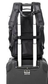
1本で2役をこなす本体背面のストラップループ