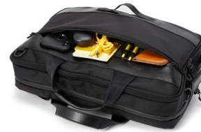
小物の収納に便利なフロントファスナー内のオーガナイザー

「URBAN COMMUTER 2x3WAY BRIEF PACK」は、都市通勤者のためにデザインされた特別なブリーフバックです。変換可能な6通りのアレンジで、毎日の通勤から出張までを1つのバッグでカバーします。機能的なビジネスバッグとしての十分な性能に加え、着脱式のガーメントケースを備えた大容量のこのモデルは、シチュエーションによって本体のサイズと重量を調整できる革新性でビジネスバッグの新境地を切り開きます。鞆の産地として千年にも及ぶ歴史と伝統を誇る「鞆の街 豊岡」。地域財産でもある生産地ブランド「豊岡鞆®」とのコラボレーションによって、革新的なデザインと確かな技術を掛け合わせた新たなスタンダードをご提案します。