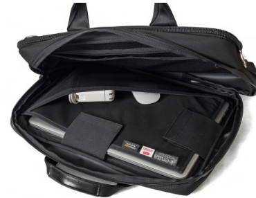
PC用のスリーブとストレッチの効いたメッシュポケット