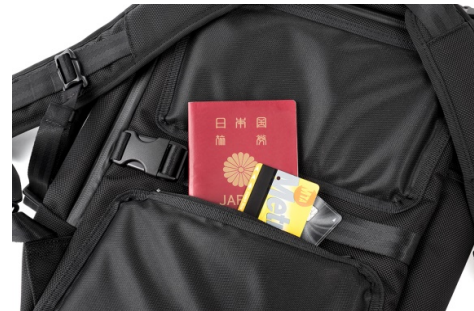
本体背面のクッションパッドを利用した隠しポケット

鞆の産地として千年にも及ぶ歴史と伝統を誇る「鞆の街 豊岡」。地域財産でもある生産地ブランド「豊岡鞆®」とのコラボレーションによって、革新的なデザインと確かな技術を掛け合わせた新たなスタンダードをご提案します。