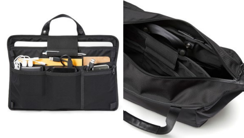
デジタルデバイスと周辺機器は着脱式のパネルで一括収納