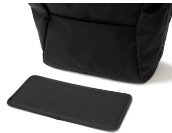
底面内装にはクッション性に優れた着脱可能な底板を配置

「URBAN COMMUTER 2WAY TOTE BAG 2」は都市通勤者のためにデザインされたミドルサイズのビジネストートです。コーディネートを選ばないクリーンな外観と、ビジネスシーンをより快適にサポートする機能性を両立しています。肩掛けのままの移動時間を快適にする機能性、最高のプレゼンテーションに必要なビジネスツールを効率良く収納する機能性、そして最高のパフォーマンスに直結するスマートなビジュアルを兼ね備えたハイエンドなアイテム。鞆の産地として千年にも及ぶ歴史と伝統を誇る「鞆の街 豊岡」。地域財産でもある生産地ブランド「豊岡鞆®」とのコラボレーションによって、革新的なデザインと確かな技術を掛け合わせた新たなスタンダードをご提案します。