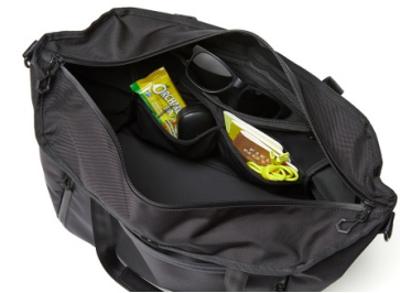
本体前面の裏側には仕分けに便利なフリーポケット×3

特徴： 13.3インチまでのPCとデバイス周辺機器を一括収納する着脱式パネル バッグ内でのモバイルデバイスへの充電と使用時のイージーアクセス キャスターバッグのハンドルに固定できる本体背面のループ 荷重を安定させバッグの形状を保持する着脱式の底板 安定性の高いハンドルと馴染みの良いレザーグリップ