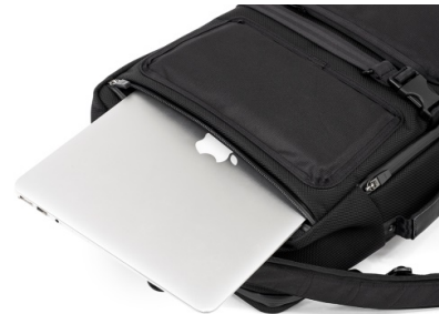
本体背面からの出し入れとなる独立式のPCスリーブ

品番： brf-UC05-HA 販売価格： ¥27,000 納期： 2月上旬 寸法： W： 280mm H： 420mm D： 140mm 容量： 17ℓ 重量： 700g 素材 / 表 CORDURA® Ballistic Hollofil AIR™ ナイロン（撥水コート） ポリエステル | 牛革パーツ 素材 / 裏 Tefox® 420デニールナイロン（テフロンコート） ポリエステル 色： BLACK NAVY 原産国： JAPAN