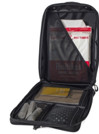
着替えやプライベートな荷物用の着脱式コンパートメント