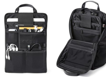
デジタルデバイスと周辺機器は着脱式のパネルで一括収納