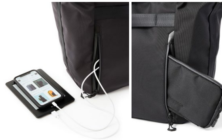
サイドポケットを活用すれば移動中もストレスフリーに

品番： brf-UC07-HA 販売価格： ¥34,000 納期： 2月上旬 寸法： W： 510mm H： 340mm D： 170mm 容量： 20 ℓ 重量： 1,000g 素材 / 表 CORDURA® Ballistic Hollofil AIR™ ナイロン (撥水コート) ポリエステル | 牛革パーツ 素材 / 裏 Tefox® 420デニールナイロン (テフロンコート) ポリエステル 色： BLACK NAVY 原産国： JAPAN