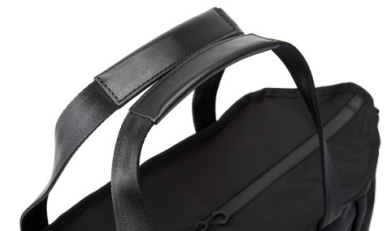
安定性に優れたハンドルと馴染みの良いグリップ