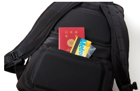
本体背面のクッションパッドを利用した隠しポケット