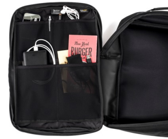
仕分け収納に便利なフロント内のオーガナイザー