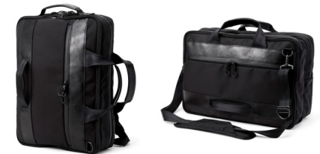
2段階のサイズ調整と各サイズで3WAYの使用法の6WAY