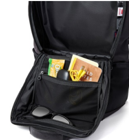
本体前面の裏側にはファスナー開閉のフリーポケット×2