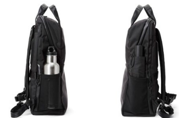
タンブラーや折り畳み傘を収納できるストレッチポケット