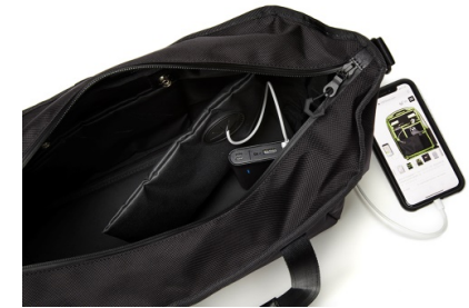
サイドポケットの内袋は充電ケーブルを通せる仕様

品番： brf-UC07-HA 販売価格： ¥34,000 納期： 2月上旬 寸法： W： 510mm H： 340mm D： 170mm 容量： 20 ℓ 重量： 1,000g 素材 / 表 CORDURA® Ballistic Hollofil AIR™ ナイロン (撥水コート) ポリエステル | 牛革パーツ 素材 / 裏 Tefox® 420デニールナイロン (テフロンコート) ポリエステル 色： BLACK NAVY 原産国： JAPAN