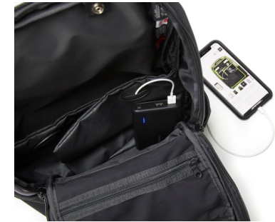
サイドポケットの内袋は充電ケーブルを通せる仕様