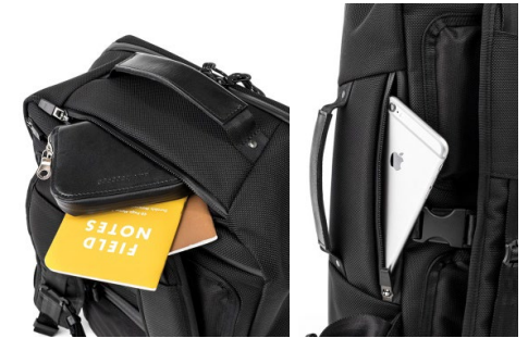
片手でスムーズに開閉できるハンドル脇のポケット

品番： brf-UC05-HA 販売価格： ¥27,000 納期： 2月上旬 寸法： W： 280mm H： 420mm D： 140mm 容量： 17ℓ 重量： 700g 素材 / 表 CORDURA® Ballistic Hollofil AIR™ ナイロン（撥水コート） ポリエステル | 牛革パーツ 素材 / 裏 Tefox® 420デニールナイロン（テフロンコート） ポリエステル 色： BLACK NAVY 原産国： JAPAN