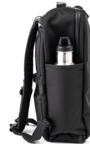
タンブラーや折り畳み傘を収納できるオープンポケット

特徴： 13.3インチまでのサイズに対応する本体背面の独立式のPCスリーブ 2方向に配置したハンドルグリップ脇の小物用ファスナーポケット ストレッチメッシュを使用したメインコンパートメント内のオーガナイザー 外装背面のクッションパッド裏に配置したセキュリティポケット キャスターバッグへの固定とハーネスの簡易まとめを兼ねるストラップ