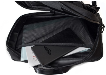
薄物の仕分けに便利なメインコンパートメント内のポケット